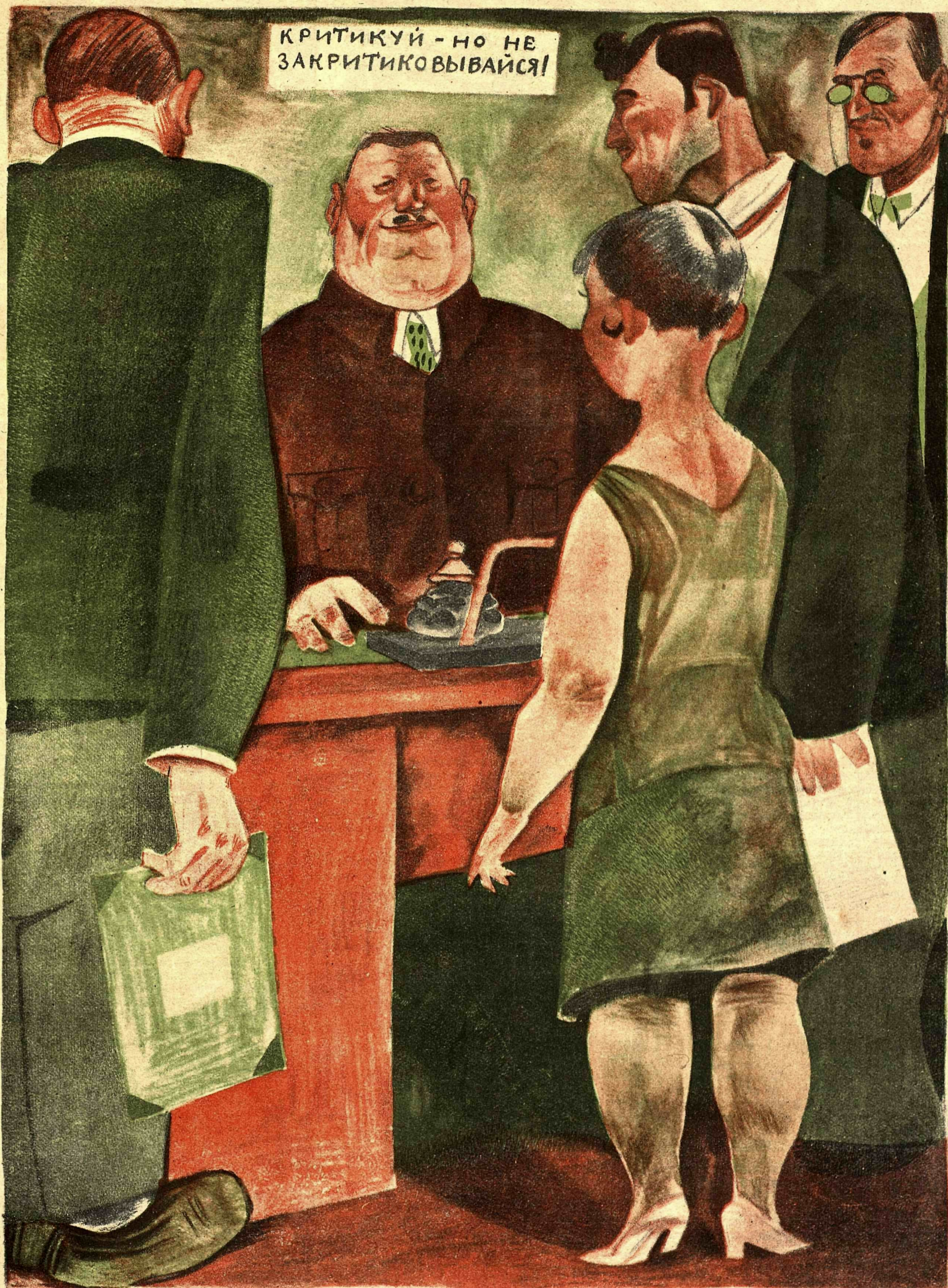
Рис. Ю. Ганфа

— Поздравляю вас. Вчера критиковали вы меня смело, резко! Так и надо! — Помилуйте-с! Изю всех своих слабых сил старался вам угодить-с!