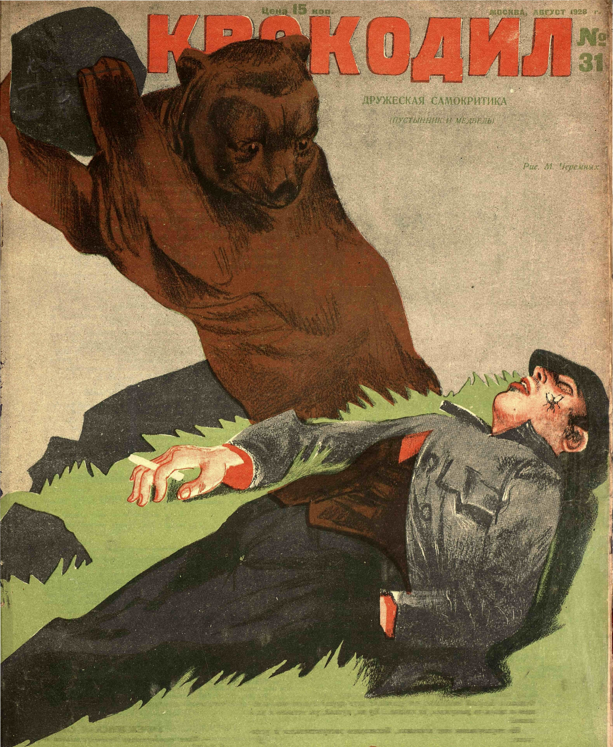
Рис. М. Черемных