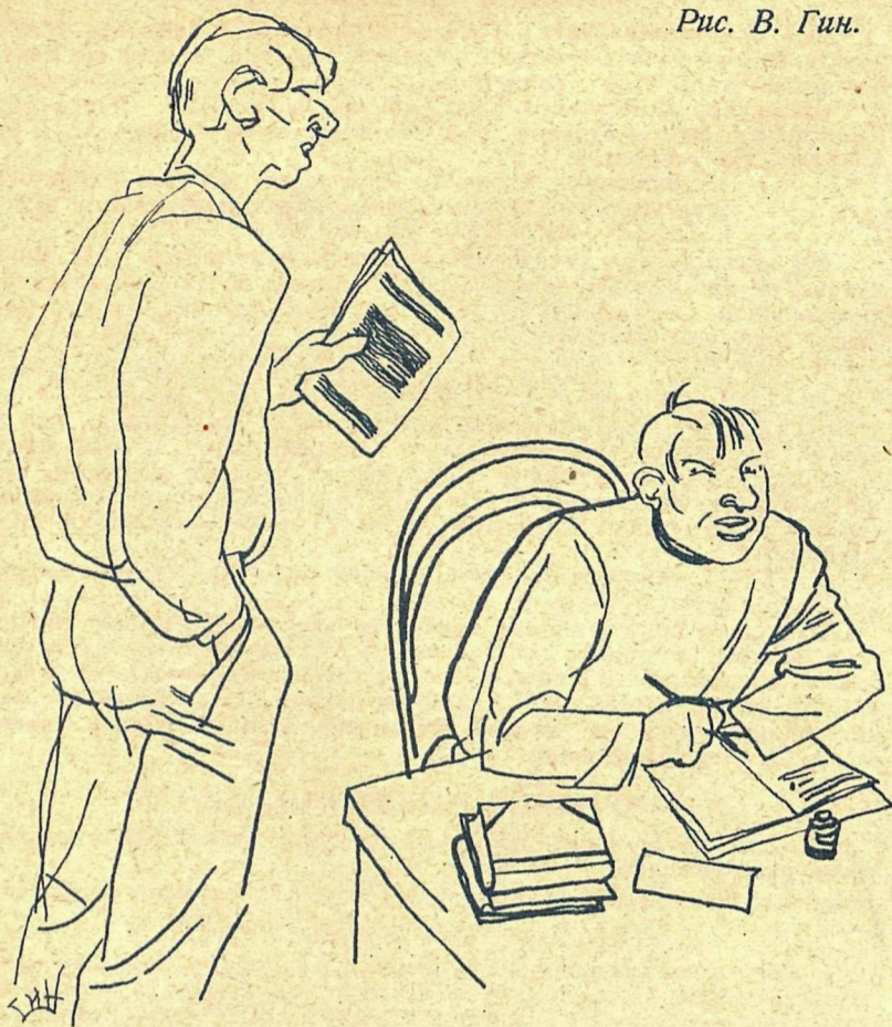
Рис. В. Гин.

— Вчера читал свой рассказ по радио... Аплодировали,—удержу нет!