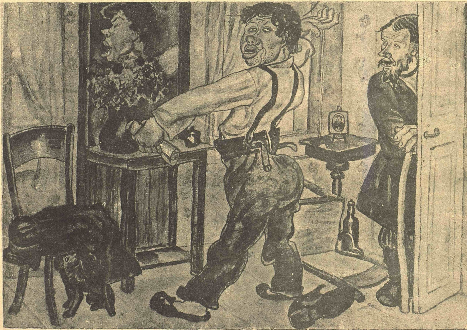
Рис. И. Каликина

Давно счетовода Левкоева Убрать из комхоза хотят. Однако убрать не легко его, Хотя он заведомый гад. Все знают — и складчик и пьяница, Все ждут: вот-вот-вот полетит. Нет! Смотришь, — спокойно останется И гордо в комхозе сидит. Левкоевской физиономии Испортить нельзя кирпичом.