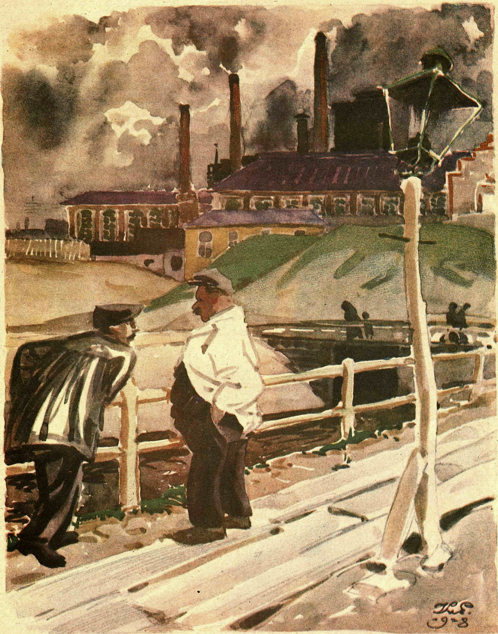
Рис. К. Елисева

— С полной нагрузкой завод работает! Интересно, что он вырабатывает? — Дощечки: „без доклада не входить“ и „закрыто на обед“.